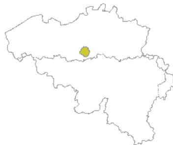
■ Het tweetalige gebied Brussel-Hoofdstad