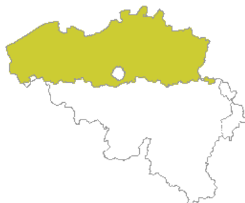
■ Het Nederlandse taalgebied