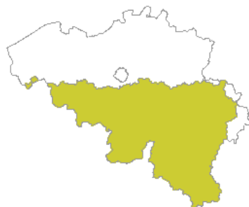
■ Het Franse taalgebied